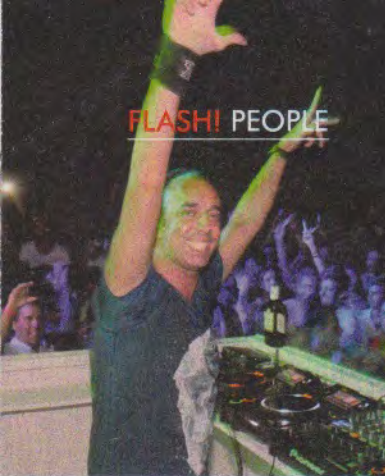
O DJ Pete tha Zouk bastante divertido